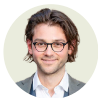
von Fabian M. Kos

In ihrem neuen Leitbild begegnet die Erzdiözese Salzburg der Frage „Wer wollen wir sein, um unsere Vision umzusetzen?“ in fünf Dimensionen – und legt damit auch den Grundstein für ihre Personalentwicklung von morgen.