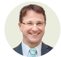
von Clemens Sedmak

Ein kleines Beispiel: In der Ukraine gibt es eine Initiative, in den Hilfspaketen für die Soldaten an der Front auch ein Gedicht einzupacken – die vermeintlich unnütze Schönheit von Worten kann an Würde erinnern – und damit „Würde-wissen“ schenken.