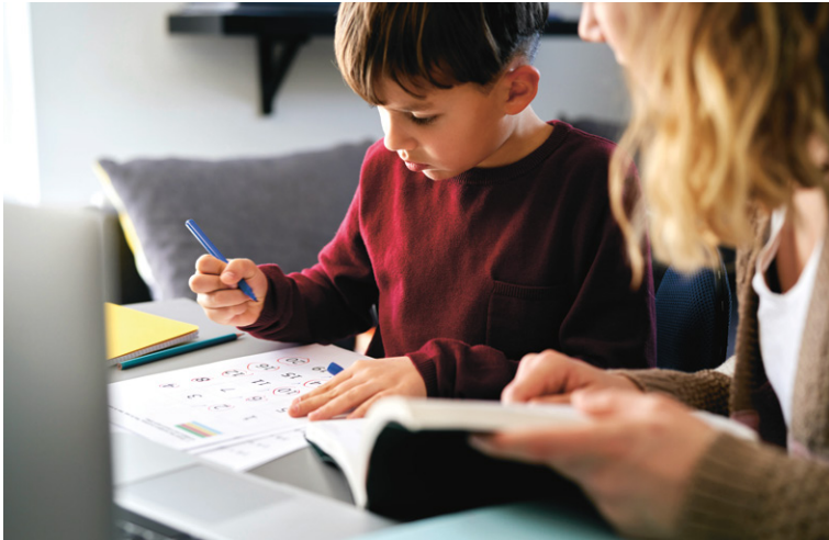
Entspanntes Lernen dort, wo sich Kinder am wohlsten fühlen – zu Hause.