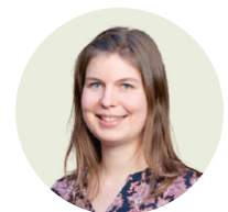
von Angelika Eisl-Kirchhofer